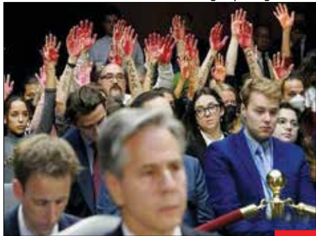
قاتل قاتل/ دولت ایالات متحده در کنار رژیم کودک‌کش صهیونیستی ایستاده و این در حالی است که مردم این کشور بیدار شده‌اند و این چنین پشت سر «آنتونی بلینکن» وزیر خارجه این کشور با دستان آغشته به رنگ خون حضور پیدا کرده و شعار «قاتل قاتل» سر می‌دهند.