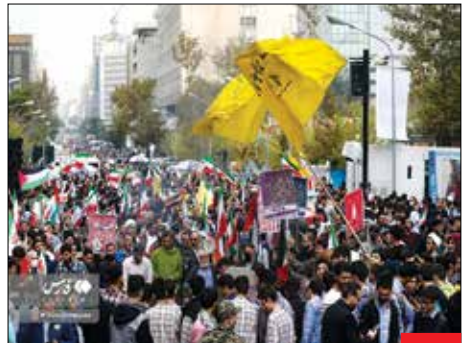
۱۳ آبان تماشایی، مراسم روز دانش‌آموز در تهران و دیگر شهرهای کشور با حضور بی‌سابقه مردم برگزار شد. این مراسم در تهران، زیر بارش باران و سخنرانی دکتر قالیباف، رئیس مجلس و تمام حجت شرکت‌کنندگان با رژیم اشغالگر قدس برگزار شد.