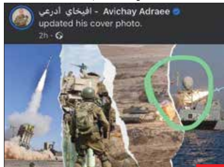
خدا شفات بده! سخنگوی سابق ارتش صهیونیستی متناً اومده عکس اقتدار ارتش‌شون رو بخاره، عکس ناو ارتش ایران را گذاشته و حتی به پرچم ایران بر روی ناو هم دقت نکرده! این بزدل‌ها به قرض گرفتن هر چیزی عادت کرده‌اند.