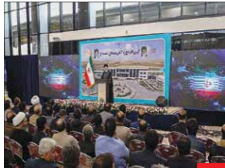
تحقیق انتظار چندین ساله، راه آهن همدان-سنندج و اتصال کردستان به شبکه ریلی کشور یکی از وعده‌های همیشگی به مردم این خطه بوده است که سرانجام در سفر هفته گذشته رئیس‌جمهور به کردستان بهره‌برداری شد. افتتاح فرودگاه سقز از دیگر برنامه‌های سفر رئیس‌جمهور به استان کردستان بود.