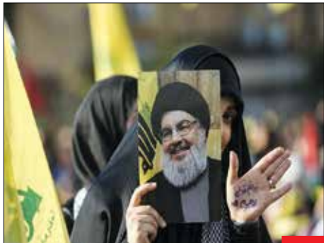
وعدہ صادق، تصویری از دختر لبنانی شرکت‌کننده در مراسم سخنرانی سیدحسین نصرالله در بیروت با نام شهدای راه قدس که در فک دست خود به فارسی جانم فدای رهبرم را نوشته است. دبیر کل حزب‌الله لبنان در این مراسم اعلام کرد، امام خاتمه‌ای وعده پیروزی فلسطینیان و مردم غزه را به او داده است.