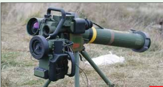
موشک‌های ضدزره دهلاویه