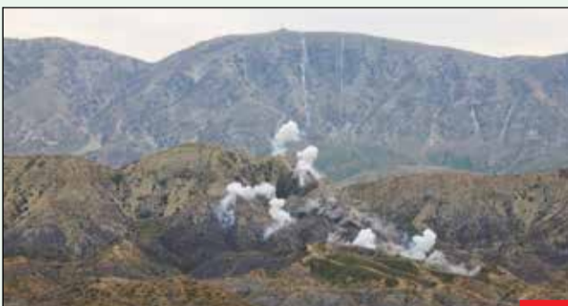
انهدام اهداف با پهبادهای سپاه