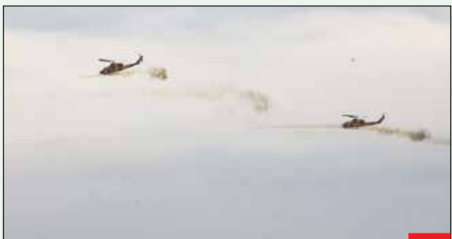
بالگردهای رزمی هوانیروز سپاه