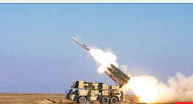
سامانه سوم خرداد