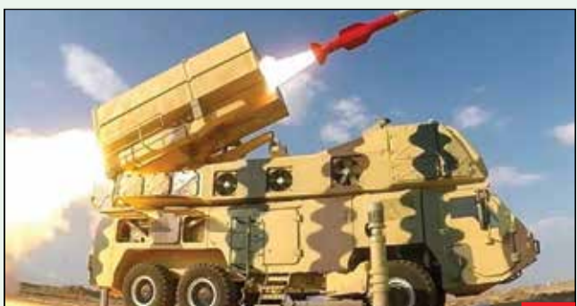
سامانه ۹ دی