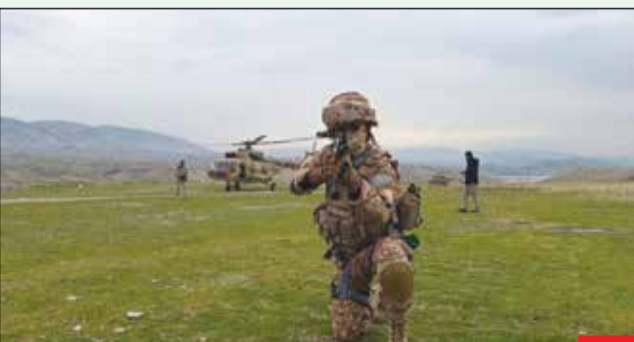
عملیات گردان ویژه تک‌تیرانداز سپاه در مرحله نهایی رزمایش