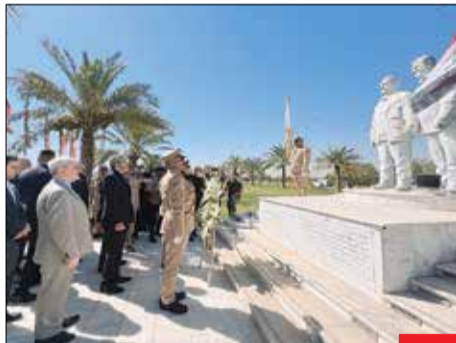
به یاد حاج قاسم/ «علی باقری» سرپرست وزارت امور خارجه ایران در محل یادمان فرماندهان شهید حاج قاسم سلیمانی و ابومهدی المهندس در نزدیکی فرودگاه بغداد حضور پیدا کرد و به مقام این شهیدان ادای احترام کرد.