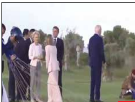
یکی اینو جمع کنه! / بایدن در این چند هفته گذشته در هر مراسمی که بوده است، آثار کبولت سنن و زوال عقل خود را بروز داده است! مراسم G7 به محلی برای شیرین‌کاری‌های رئیس‌جمهور آمریکا تبدیل شده است!