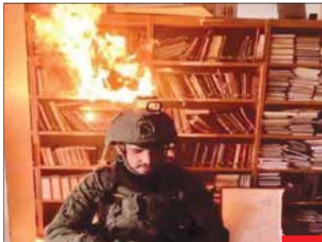
سند وحشی‌گری/ در تاریخ مغول‌ها با فرهنگ و تمدن خصومت داشتند و حال صهیونیست‌ها نشان داده‌اند که هر جا که کتاب و فرهنگ باشد، آنها تلاش را ندارند و مغولان شماره دو تاریخ شده‌اند!