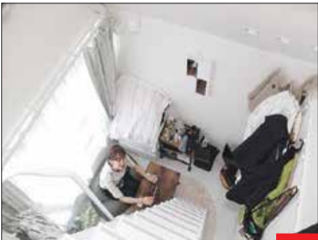
دو طبقه و متری ۹ جوان ژاپنی طرفدار خانه‌های ۹ متری شده‌اند! خانه‌هایی که همه چیز فشرده در هم جا شده و با سبک زندگی شهری ژاپنی‌ها همخوانی پیدا کرده است!