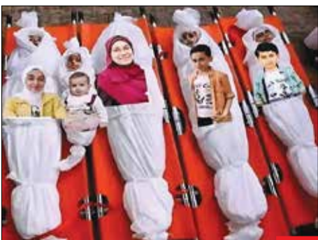
چه باید گفت/ غم این روزهای غزه قابل بیان نیست، خانواده‌ای که دسته‌جمعی پر کشیدند...