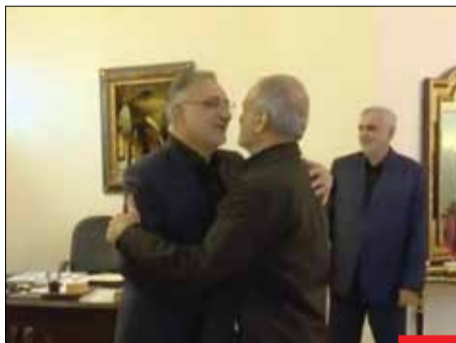
رقبای دیروز: رفقای امروز/ ضدانقلاب گمان می‌کرد مواضع نامزد‌های انتخاباتی سبب ایجاد اختلاف در دولت آینده شود، انتظار نداشتند رقبای دیروز، امروز دست دوستی بدهند و برآمدگی خود به منظور همکاری با دولت چهاردهم تأکید کنند.