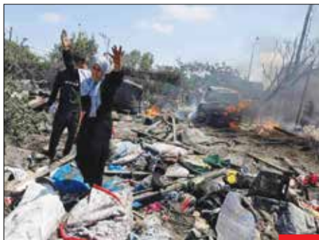
کرپلای امروز را فراموش نکنیم/ طی حمله جنگنده‌های نیروی هوایی ارتش رژیم صهیونیستی به خان یونس و استفاده از بمب‌های سنگرشکن تعداد بیشماری از فلسطینیان حاضر در خان یونس به شهادت رسیدند. این شب‌ها غزه را فراموش نکنیم.