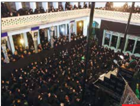
این خانه عزادار حسین (ع) است/ خانه بنکدار اصفهان که امروزه به حسینیه بنکدار معروف است، ۱۷۴ ساله است که در دهه اول محرم میزبان عزاداران است. عزاداری‌های این خانه، هر روز از اذان صبح آغاز می‌شود و تا هنگام اذان ظهر ادامه می‌یابد.