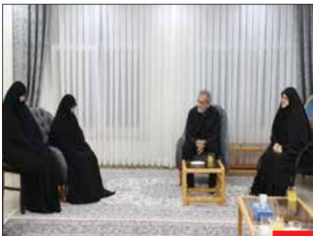
خدمات فراموش‌نشده/ پزشکان در دیدار با خانواده شهید رئیسی، از تلاش‌های ارزنده و فراموش‌ناشدنی شهید رئیسی در مسیر خدمت به مردم و پیشرفت کشور قدرانی کرد. همسر شهید رئیسی نیز در این دیدار بر ضرورت تداوم مسیر خدمت‌رسانی به مردم ایران تأکید کرد.