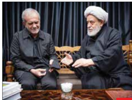
آتش به جان بیزیدیان/ دیدار رئیس‌جمهور منتخب با شیخ حسین انصاریان در مراسم عزاداری شب‌های محرم بازتاب گسترده‌ای در رسانه‌ها و شبکه‌های اجتماعی به دنبال داشت؛ اما این حضور بد جور ضدانقلاب و معاندان و لشکر بیزیدیان را سوزانده است.