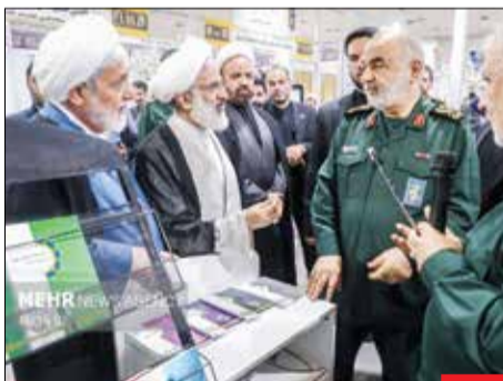
بازدید فرمانده/ سرلشکر حسین سلامی، فرمانده کل سپاه از نمایشگاه عملکرد و تحول مابیندگی ولی فقیه در سپاه پاسداران بازدید کرد. این نمایشگاه در طول ۱۰ روز میزبان بازدیدکنندگان بود.