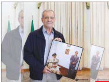
قاب خاطره/ هدیه رسانه KHAMENEI.IR به رئیس‌جمهور منتخب پس از انجام گفتگوی تفصیلی؛ قاب عکسی از دکتر پزشکیان در دیدار با رهبر معظم انقلاب در تاریخ ۱۳/۹/۱۳۸۹ بود.