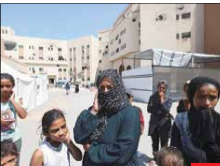
زندان از روی ناچاری/ صدها فلسطینی در زندان سابق غزه که برای نگهداری قاتلان و دزدان ساخته شده بود، به سر می‌برند. این زندان مخروبه هیچ امکاناتی ندارد و آوارگان فقط به دلیل بی‌پناه بودن به آنجا رفته‌اند.