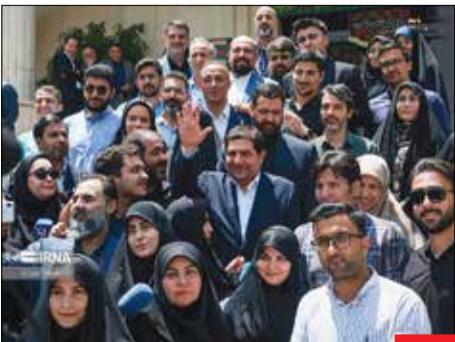
آخرین تصویر از دولت سیزدهم/ جمعی از اعضای هیئت دولت پس از جلسه در محوطه نهاد ریاست جمهوری در جمع خبرنگاران حاضر شدند و به پرسش‌های آنها پاسخ دادند. این آخرین جلسه دولت سیزدهم بود.