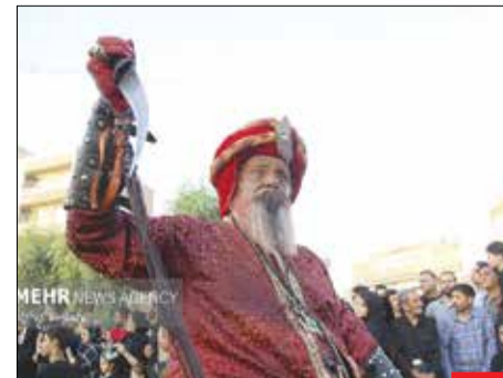
غم جانسوز/ کاروان نمادین اسراییل در قم با حضور ۲ هزار هنرمند با حرکت از خیابان امام خمینی (ره) به سمت حرم مطهر حضرت فاطمه معصومه (س) غم‌خاموش‌شدن اهل بیت عصمت و طهارت را زنده کرد.