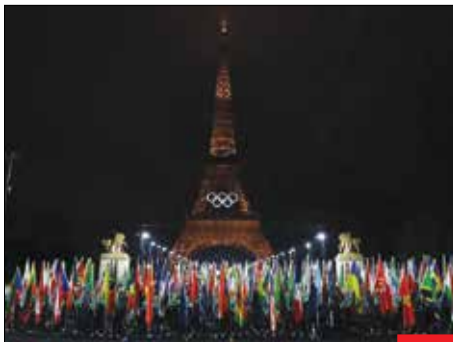
المپیک ۲۰۲۴/ بزرگ‌ترین رقابت‌های ورزشی دنیا آغاز شد؛ رقابتی که در سایه جنگ غزه قرار گرفته و مانند دوره‌های قبل توجه جهانیان را به خود جلب نکرده است.