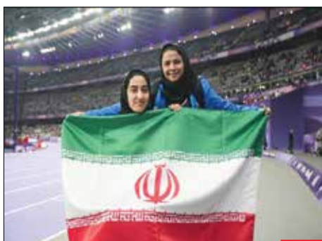
دختران ایران/ در پارالمپیک امسال دختران سرزمین‌مان خوش درخشیدند. دخترانی، مانند پرستو حبیبی و زهرا رحیمی که پرچم کشورمان را به اهتزاز درآوردند و برای بالا بردن این پرچم از جان مایه گذاشتند.