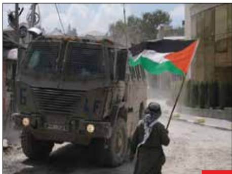
ملنی که شکست نمی‌خورد؛ نتیجه نهایی نبرد میان فلسطین و رژیم اشغالگر قدس در همین عکس خلاصه شده است. اشغالگران خود را در ماشین کشتارشان محبوس کرده‌اند و مرد فلسطینی پرچم کشورش را در دست دارد. استوار و بی‌هراس.