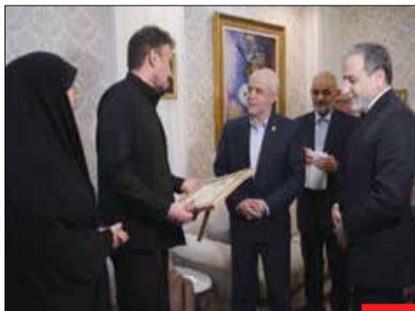
یاد یاران/ همزمان با گرامیداشت هفته دولت «سید عباس عراقچی» وزیر امور خارجه کشورمان به همراه چند نفر دیگر از اعضای کابینه دولت چهاردهم در منزل شهید امیرعبداللہیان حضور یافتند.