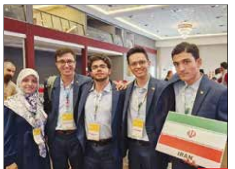
راه آسمان/ تیم المپیاد نجوم دانش‌آموزی ایران با کسب پنج نشان طلا، مقام نخست هفدهمین المپیاد جهانی نجوم و اختر فیزیک را کسب کرد. نتیجه این عملکرد موفقیت‌آمیز با پیام تبریک «سردار سلامی» فرمانده کل سپاه همراه بود.