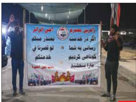
میزبانان بی‌نظیر/ جوانان عراقی که در ایام ربیعین در موکب‌هایشان از جان و دل برای پذیرایی زوار هزینه کردند و سنگ تمام گذاشتند، در پیامی گفتند: «اگر در خدمت‌رسانی به شما کوتاهی کردیم، ما را ببخشید.»