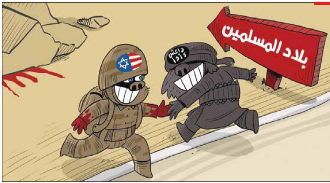
هم‌پایه! / کارتون‌نویست: کمال شرف/ یمن